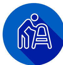
Возраст (риск ХБП с возрастом увеличивается)