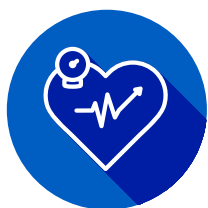
Высокое артериальное давление (гипертония)