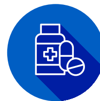
Некоторые лекарства токсичны для почек

Если у вас есть любой из этих факторов риска, важно поговорить с врачом в здоровье ваших почек. Но даже если у вас нет этих факторов риска, все равно неплохо регулярно проверяться у врача, чтобы почки долго оставались здоровыми.