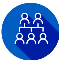
Случаи ХБП в семье